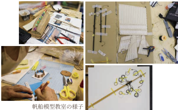
帆船模型教室の様子

教室で講師・アドバイザーを務める神戸帆船模型の会の会員が製作した帆船模型作品を展示します。